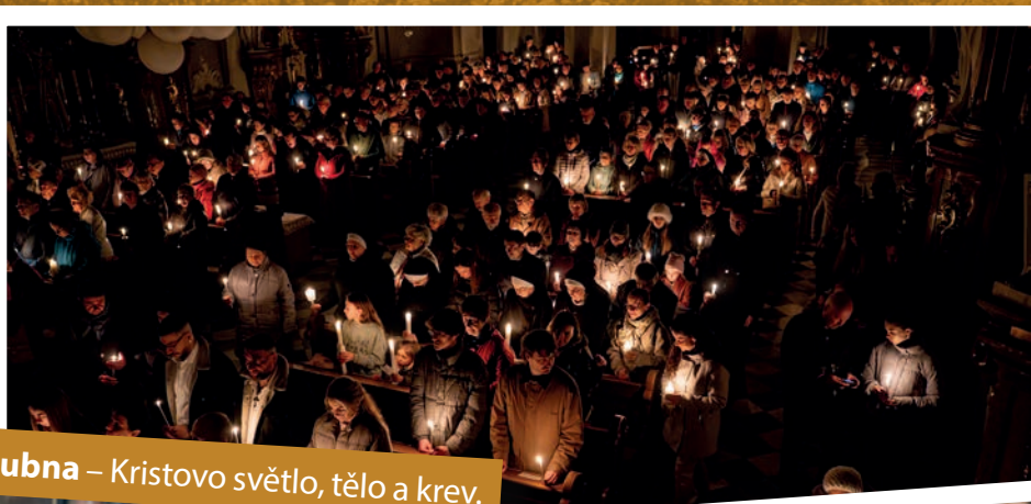
Bílá sobota 4. dubna – Kristovo světlo, tělo a krev.