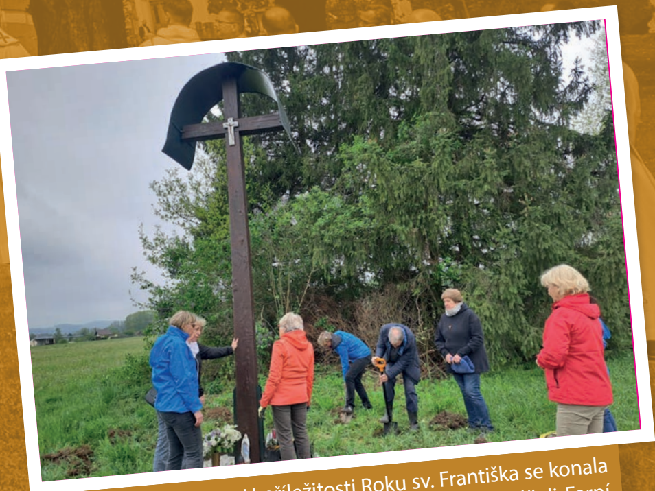
Růže pro Františka - U příležitosti Roku sv. Františka se konala 8. května akce Růže pro Františka, na které se podíleli Farní společenství Zelinkovic a Lysůvek, Terciáři sv. Františka Frýdek-Místek, Farnost Místek a Příroděnka. V rámci akce účastníci vysadili růže kolem kříže.