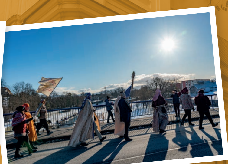
Tříkrálový průvod – Na podporu charitativní sbírky prošel městem v sobotu 3. ledna Tříkrálový průvod.