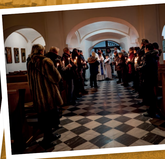
Žehnání svící - Svátek Uvedení Páně do chrámu 2. února